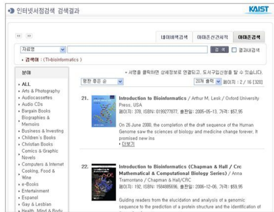
<국내외 단행본 검색>