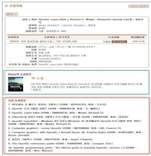
<단행본 상세화면 확장>